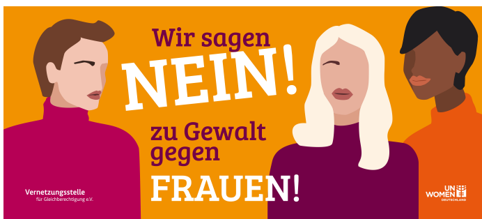
Die Banner-Fahne im Querformat ist ringsherum mit einem Band verstärkt und hat an der Ober- und Unterkante vier Ösen. Maße 80x180 cm