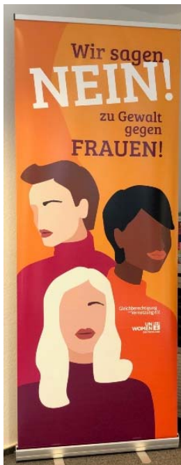
Roll-Up Banner Maße 85x220 cm optional zzgl. eigenem Logo an der Seite