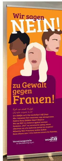
Roll-Up Banner (Sprachen) Maße 85x220 cm optional zzgl. eigenem Logo unten in der Mitte Der Titel "Wir sagen nein zu Gewalt gegen Frauen!" wurde in zehn verschiedene Sprachen übersetzt (Kurdisch-Kurmanci, Farsi, Arabisch, Polnisch, Türkisch, Englisch, Russisch, Spanisch, Französisch, Bulgarisch)