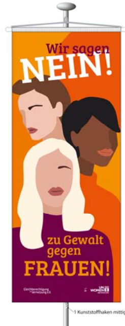
Banner-Fahne Maße 120x300 cm mittige Hängung mit einer Querstange optional zzgl. eigenem Logo unten in der Mitte